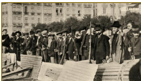
Revoltosos na rotunda do Marquês de Pombal

Uma revolução veio pôr fim ao regime monárquico vigente e implantou a República em Portugal, no dia 5 de outubro de 1910.