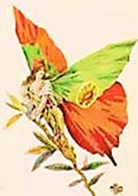
A metamorfose de Portugal