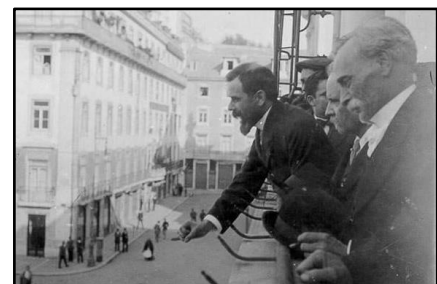
José Relvas proclama a República

Na manhã do dia 5, José Relvas , membro do Partido Republicano, proclamou a República , a partir de uma varanda da Câmara Municipal de Lisboa.